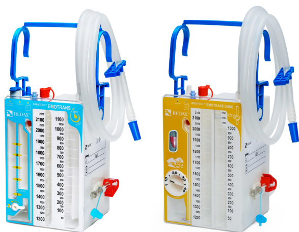
ZESTAWY DO AUTOTRANSFUZJI