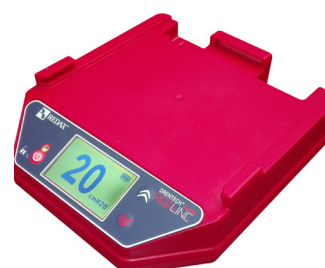
PRZENOŚNE POMPY PRÓŻNIOWE