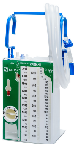
ZESTAWY Z SUCHĄ REGULACJĄ SIŁY SSANIA