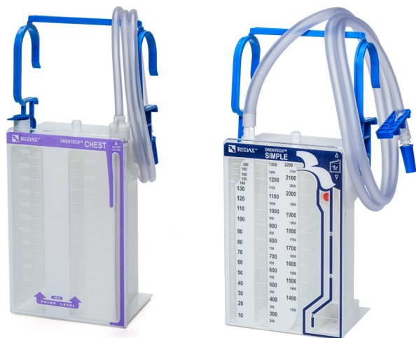
ZESTAWY JEDNO I DWUKOMOROWE