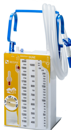
ZESTAWY CAŁKOWIIE SUCHE