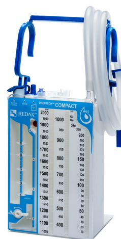
ZESTAWY Z WODNĄ REGULACJĄ SIŁY SSANIA